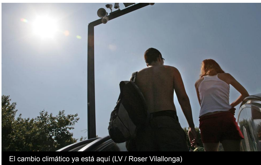
El cambio climático ya está aquí

La superficie con clima semiárido ha aumentado en 30.000 kilómetros cuadrados en las últimas cinco décadas en España