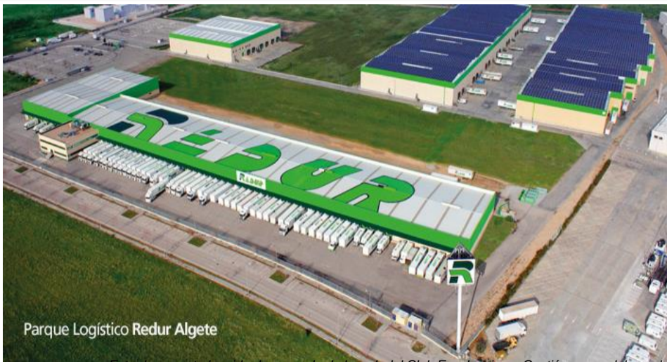
Parque Logístico Redur Algete

Este documento ha sido descargado de la web del Club Excelencia en Gestión: www.clubexcelencia.org