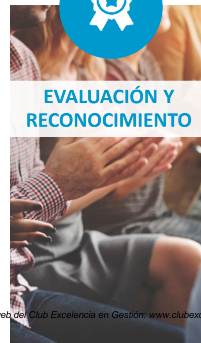
EVALUACIÓN Y RECONOCIMIENTO