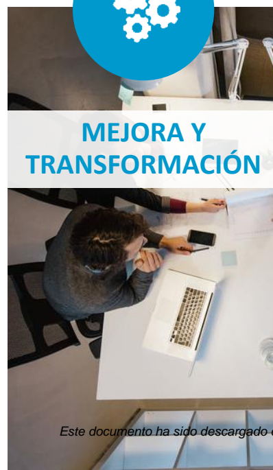
MEJORA Y TRANSFORMACIÓN