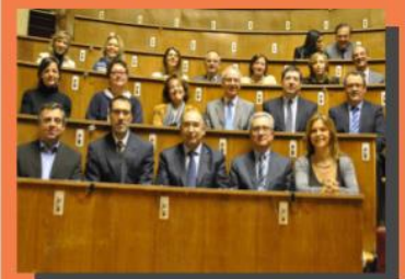
REUNIÓN DE COORDINACIÓN