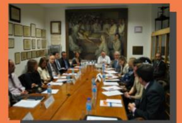
REUNIÓN GRUPO DE TRABAJO