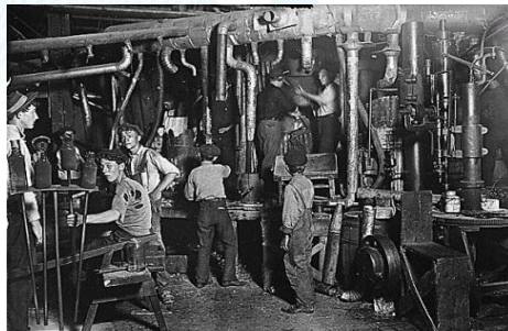
1910 Revolución Industrial INY / IVS