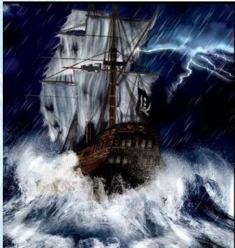
1828 Naugrafios Marina