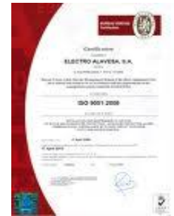
1980's Gestion QHSE CER