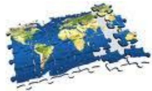
1950's Expansion Internacional GSIT