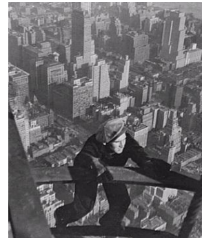
1929 Boom inmobiliario CTC