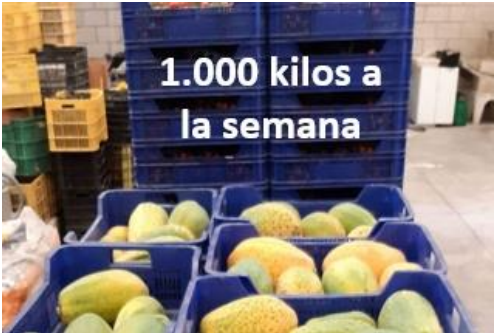
1.000 kilos a la semana