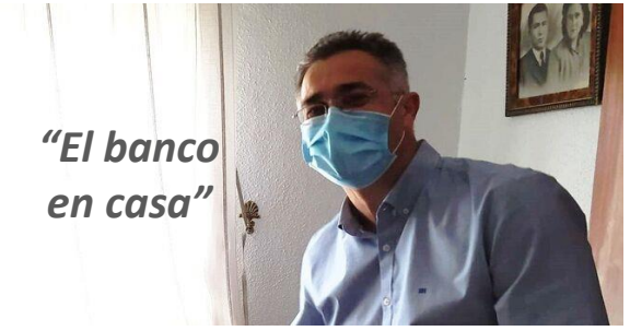
"El banco en casa"