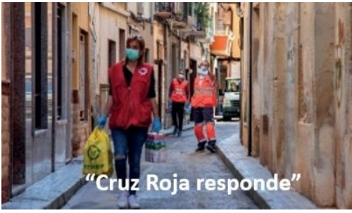
"Cruz Roja responde"

En estos momentos de especial dificultad es cuando verdaderamente adquiere sentido hablar de responsabilidad, de ayuda mutua y de solidaridad, valores cooperativos todos ellos que son los que conforman nuestra cultura empresarial.