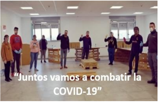
"Juntos vamos a combatir la COVID-19"