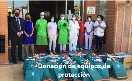
Donación de equipos de protección