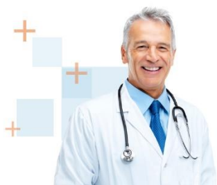
Reuniones con el Experto