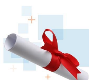
Premio de buenas prácticas