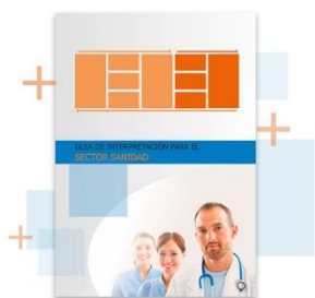
Guía de interpretación del Modelo EFQM