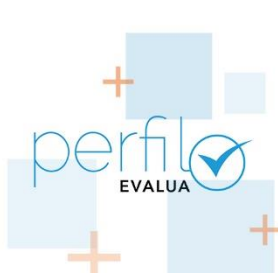
Adaptación Perfil autoevaluación