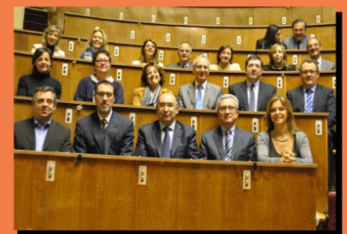
REUNIÓN DE COORDINACIÓN