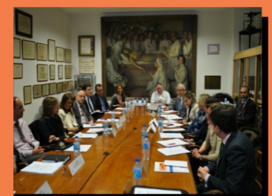
REUNIÓN GRUPO DE TRABAJO