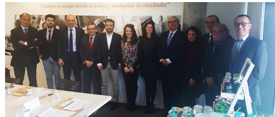
Nuevos horizontes en la externalización - Productividad vs Reputación