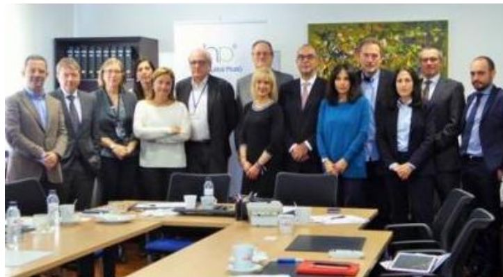
Modelos de liderazgo