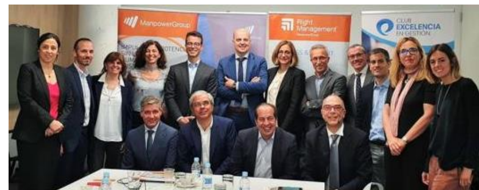
Liderazgo Digital: Clave de Transformación