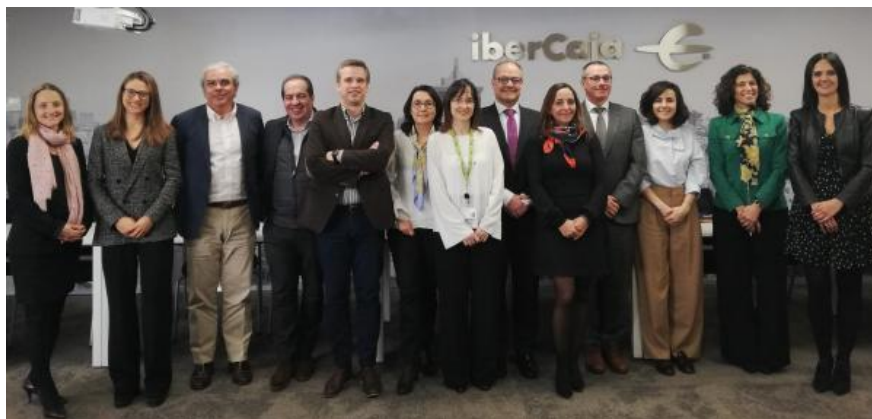
Claves para implantar un plan estratégico en una organización excelente