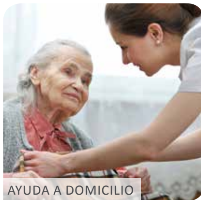
AYUDA A DOMICILIO