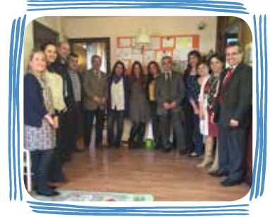
PREMIOS DE INNOVACIÓN Y BUENAS PRÁCTICAS (1 premio al año)

“En total han sido premiados, en el año, más de 100 profesionales de EULEN Sociosanitarios”