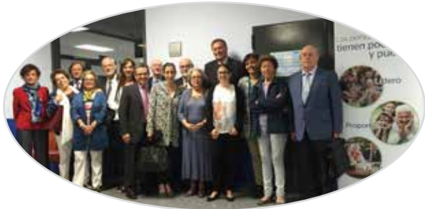
II Jornada LideA de visualización positiva y liderazgo de las personas mayores. Madrid, 2016.

"En 4 años, 7 jornadas con la participación de más de 600 personas".