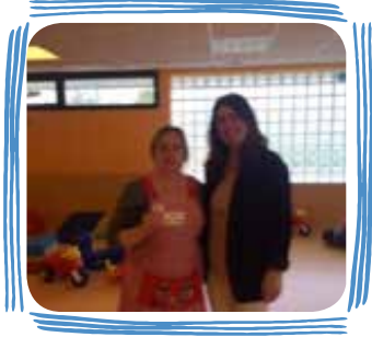
PREMIOS POR FELICITACIONES (7 premios al año)

Contamos con un sistema de premios , que tiene las siguientes categorías: