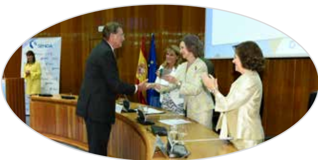
II Premio de liderazgo de personas mayores EULEN-SENDA a CAUMAS (2015).