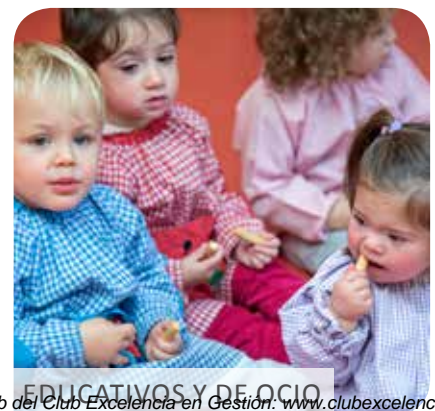
EDUCATIVOS Y DE OCIO