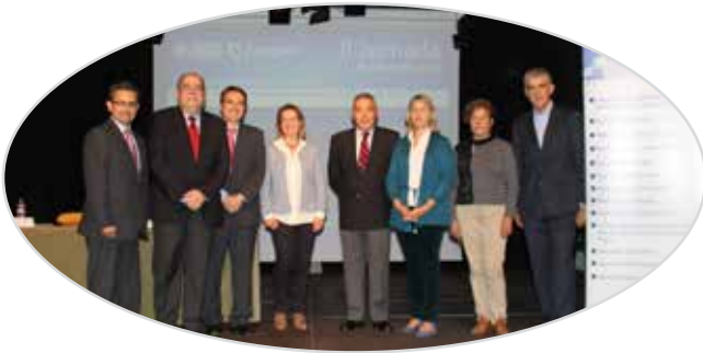
I Jornada de liderazgo y participación de mayores en Zaragoza (2013) .