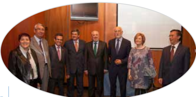
III Jornada de liderazgo y participación de mayores en Logroño (2014).