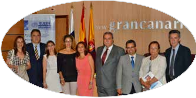
II Jornada de liderazgo y participación de mayores en Las Palmas de Gran Canaria (2013).