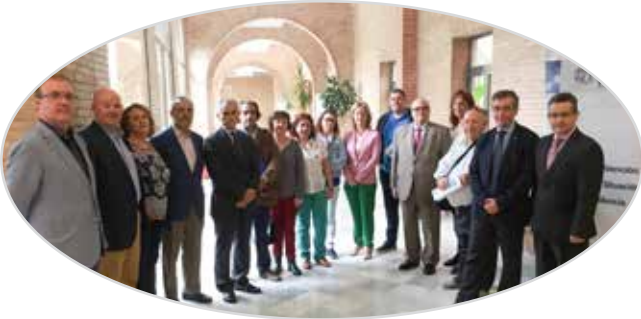
VII Jornada de liderazgo de personas mayores en Sevilla (2016).