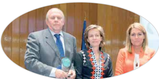
I Premio de liderazgo de personas mayores EULEN-SENDA a CEATE (2014).