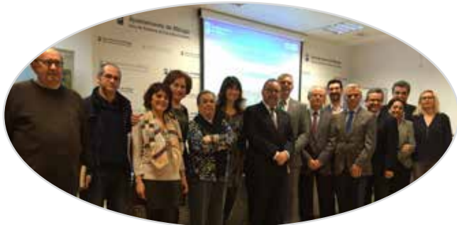
VI Jornada de liderazgo y participación de mayores en Málaga (2016).