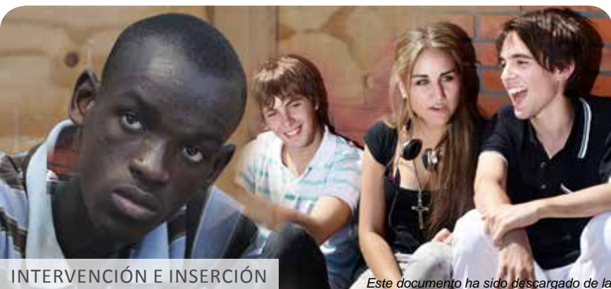
INTERVENCIÓN E INSERCIÓN