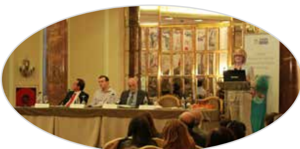
II Jornada de esterilización de EULEN Sociosanitarios en Madrid (2014).