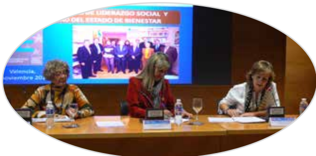
IV Jornada de liderazgo y participación de mayores en Valencia (2014).