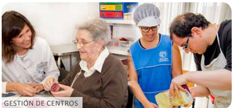
GESTIÓN DE CENTROS