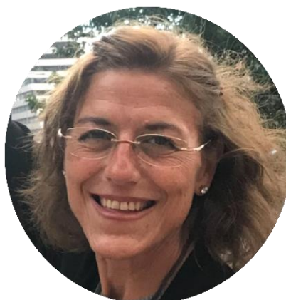
Paz de Torres 2

Asociación por la Calidad y la Cultura Democráticas. España