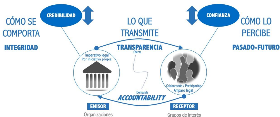
Gráfico 1. Mapa de las principales Entidades-Relaciones

Si la confianza que un ciudadano deposita en las instituciones que regulan su vida en sociedad ya no depende solo de lo que ha dependido siempre, sino de algo más ¿hacia dónde deben encaminarse los esfuerzos cuando el objetivo es recuperar la confianza perdida?, ¿con qué nueva disposición, mirada o talante debemos entender y practicar la transparencia? Pues parece incontrovertible que limitarse a acudir a las fuentes, a los usos y costumbres de siempre, antes reseñados por medio de diversos ejemplos, ha dejado de ser suficiente.